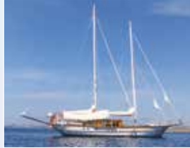
Eylülde suya inen Santa Maria yeni görünümüyle dikkat çekici.

Altı ay gibi kısa bir sürede tüm bu işlemleri tamamlanan Santa Maria, RINA klas kurallarına uygun olarak yeniden sertifikalandırılarak sahibine eylül ayında teslim edilmiş.