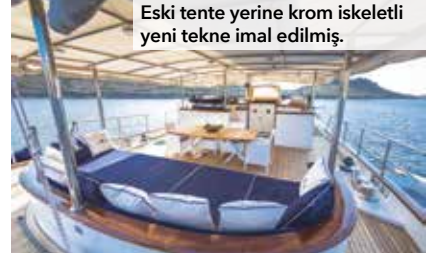
Eski tente yerine krom iskeletli yeni tekne imal edilmiştir.

Mevcut alüminyum heçler yenileriyle değiştirilirken, master kamara üzerinde yer alan heç, teknenin geleneksel çizgilerine uygun yeniden yapılmış.