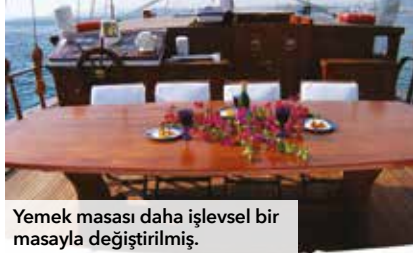
Yemek masası daha işlevsel bir masayla değiştirilmiştir.

2005 yılında Ege Yat Tersanesi tarafından Bodrum İçmeler'de denize indirilen ve sahibine teslim edilen 30 metre boya ve 7 metre enine sahip, üç kamaralı klasik gulet Santa Maria denizde geçirdiği 13 yılın sonunda refit çalışmaları için 2018 ilkbaharında ilk yuvası olan Ege Yat'ta karaya alınmış. Dalış tutkunu işadamı sahibi tarafından uzun seyirler için yaptırılan gulette ilk olarak projelendirme çalışmasıyla yenilenmesi gereken yerler belirlenmiş. Projelendirme sonrasında küpeşterin yükseltilmesi, bastonun uzatılması ve armanın yenilenmesi gibi yapısal değişiklikler çizim üzerinde